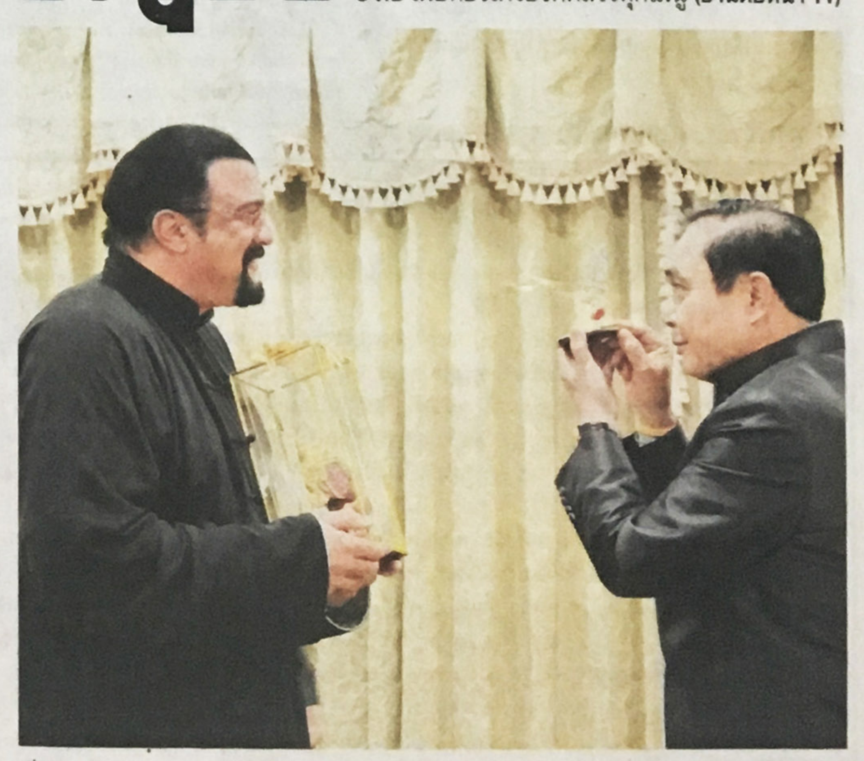
เยียมคารวะ - นายสตีเว่น ซีกัล นักแสดงและผู้กำกับภาพยนตร์แห่งฮอลลีวู้ด เข้าเยี่ยมคารวะ พล.อ.ประยุทธ์ จันทร์โอชา นายกรัฐมนตรี ที่ทำเนียบรัฐบาล เมื่อวันที่ 25 ตุลาคม