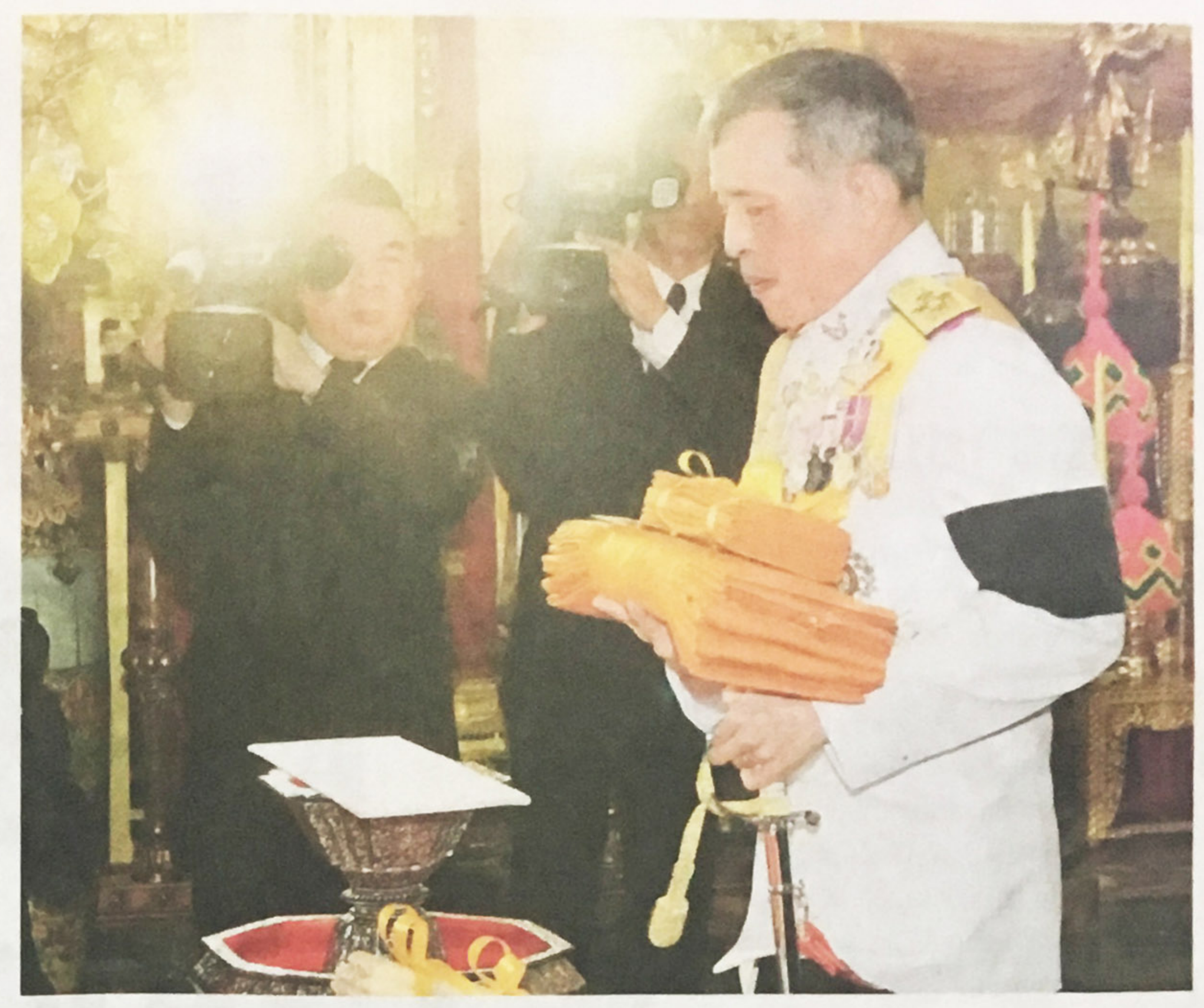
สมเด็จพระบรมโอรสาธิราชฯ สยามมกุฎราชกุมาร เสด็จพระราชดำเนินไปในการพระราชพิธีทรงบำเพ็ญพระราชกุศลถวายผ้าพระกฐิน พุทธศักราช 2559 ณ วัดเบญจมบพิตรดุสิตวนาราม เมื่อวันที่ 25 ตุลาคม

สมเด็จพระเทพรัตนราช สุดาฯ สยามบรมราชกุมารี ทรงไหว้และสวมกอด ___ ทูลกระหม่อมหญิงอุบล =3 รัตนราชกัญญา สิริวัฒนา =° พรรณวดี พระเชษฐภคินี ______ภายหลังเสร็จพระราชพิธี อ อรรมสวดพระอภิธรรม 🗢 สมเด็จพระเจ้าอยู่หัวภูมิพล อดุลยเดช ณ พระที่นั่งดุสิต มหาปราสาท ในพระบรม